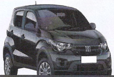
2º Prêmio: Fiat Mobi EASY 1.0 FLEX MANUAL, Ano 2021, Modelo 2022