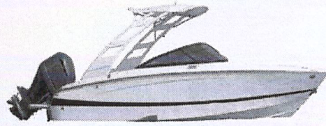
1º Prêmio: Lancha motorboat Evinrude 225