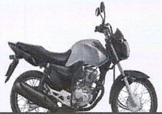
3º Prêmio: Motocicleta CG 160cc START - Ano/Modelo 2022